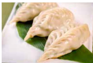
▲ 生煎芹香饺 PAN - FRIED DUMPLING WITH MINCED PORK AND LEEK