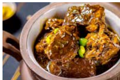
▲ 梅菜扣雪花牛肉 BRAISED BEEF FILLET WITH PRESERVED VEGETABLE

All prices are net in RMB. 以上价目均为净价以人民币结算。