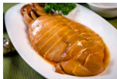
▲ 关东醉鲜鱿 MARINATED FRESH SQUID WITH CHINESE WINE

All prices are net in RMB. 以上价目均为净价以人民币结算。