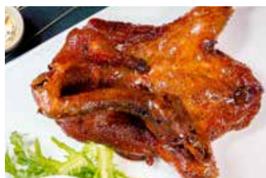
▲ 百草香卤鸭 MARINATED DUCK WITH HERB FLAVOUR