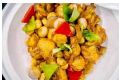
▲ 台南三杯鸡 BRAISED CHICKEN WITH TAIWAN STYLE