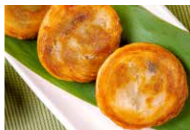
▲ PAN CAKE