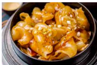
▲ 黑松露支竹花胶筒

BRAISED FISH MAW & BEANCURD STICKS WITH BLACK TRUFFLE