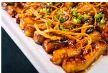
▲ 虫草花蒸茄子 STEAMED EGGPLANT WITH CORDYCEPS FLOWER