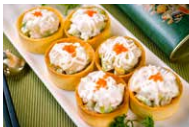
▲ 牛油果澳带塔 MIXED SCALLOP AND AVOCADO WITH PASTRY