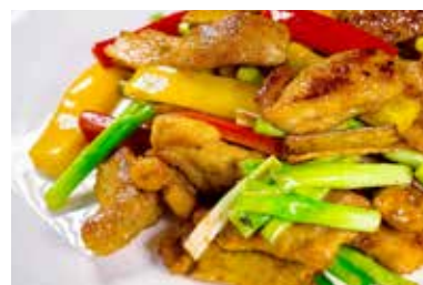
▲ 姜葱海鲜鸡 FRIED CHICKEN WITH GINGER AND SPRING ONION

All prices are net in RMB. 以上价目均为净价以人民币结算。