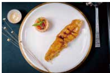
▲ 黑松露花胶筒 BRAISED FISH MAW WITH BLACK TRUFFLE