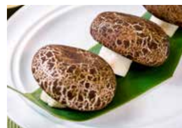
▲ 像形蘑菇包 STEAMED BARBECUED PORK BUN

All prices are net in RMB. 以上价目均为净价以人民币结算。