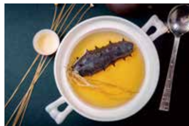
▲ 养身辽参汤 BRAISED SEA CUCUMBER SOUP

All prices are net in RMB. 以上价目均为净价以人民币结算。