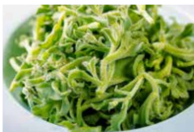
▲ 醋汁南极冰草 MARINATED ICE VEGETABLES WITH VINEGAR