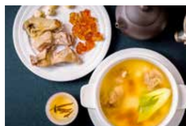
▲ 桃胶莲心炖水鸭 BRAISED DUCK SOUP WITH LOTUS SEED

All prices are net in RMB. 以上价目均为净价以人民币结算。