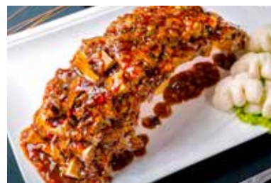
▲ 过桥排骨 BOILED PORK RIBS WITH ONION