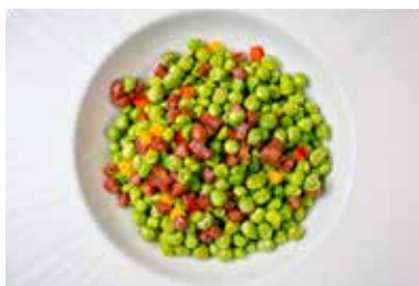
▲ 云腿小豌豆 SAUTEED HAM WITH GARDEN PEA