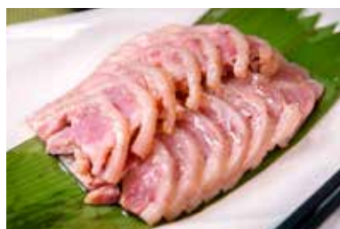
▲ 藤椒手扎蹄 PORK HOCK WITH CHILI