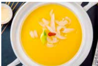
▲ 黄焖鱼唇汤 BRAISED FISH MAW SOUP