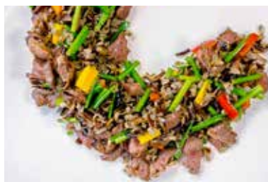
▲ 野米安格斯 FRIED DICED BEEF WITH WILD RICE

All prices are net in RMB. 以上价目均为净价以人民币结算。