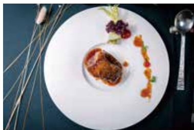
▲ 果木烤牛排 BAKED BEEF FILLET WITH FLAVOR WITH LYCHEE WOOD