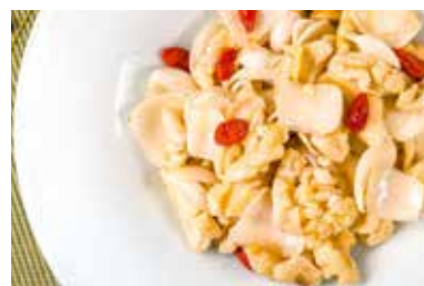
▲ 枸杞核桃拌百合 MARINATED WOLFBERY & WALNUT WITH FRESH LILY

All prices are net in RMB. 以上价目均为净价以人民币结算。