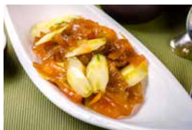
▲ 翡翠雪花翅 SLICE JELLY FISH WITH SOYA SAUCE