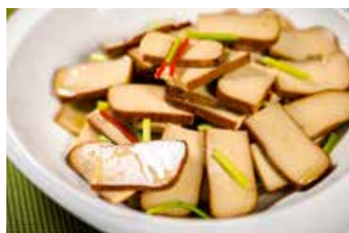
▲ 香茜鸡蛋干 EGG PUDDING WITH CORIANDER