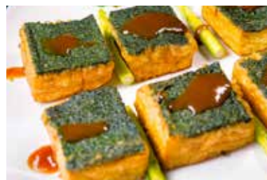
▲ 鲍汁健康豆腐 BRAISED HOMEMADE BEAN CURD IN ABALONE SAUCE

All prices are net in RMB. 以上价目均为净价以人民币结算。