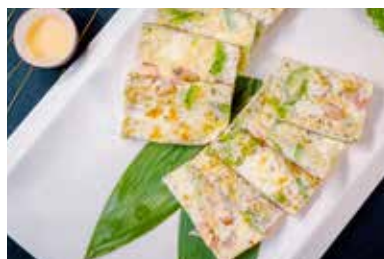
▲ 鲜虾凉瓜煎蛋白 PAN FRIED SHRIMP & BITTER MELON WITH EGGWHITE