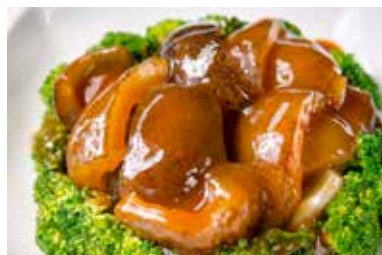
▲ 鲍汁扒海参 BRAISED SEA CUCUMBER IN ABALONE SAUCE