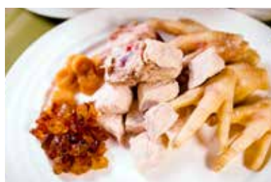
▲ 瑶柱炖桃胶 BOILED DRIED SCALLOP WITH PEACH GUM