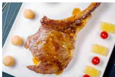
▲ 战斧牛排 PAN FRIED BEEF RIBS