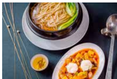
▲ 特色辣酱面 NOODLE SOUP WICH HOMEMADE CHILI SAUCE