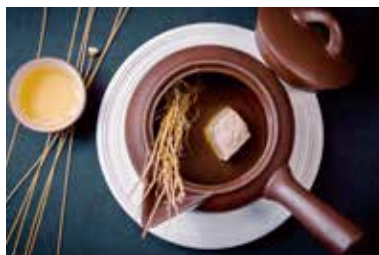
▲ 功夫肉汁汤 BRAISED PORK SOUP