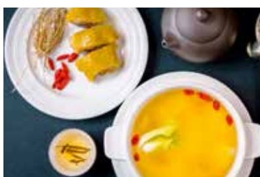
▲ 五指毛桃炖土鸡 BRAISED CHICKEN WITH PEACH